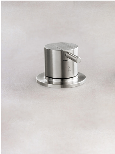
2500 Eingriffmischer für Tischmontage Edelstahlmantel-Anschlusschläuche 10 mm. Lochbohrung 42 mm für größere Durchflussleistung wie z.B. Wannenfällung.