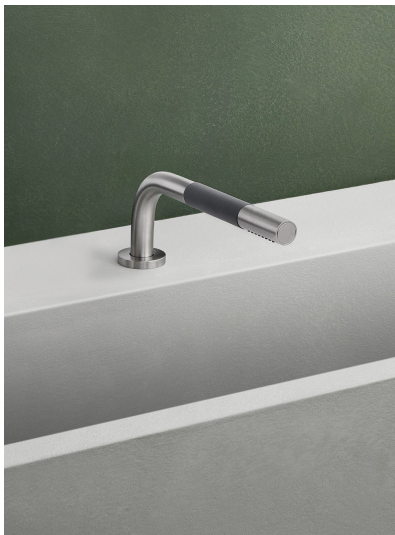
T1 Versenkbare Handbrause 90° für Montage auf dem Wannenrand bzw. auf dem Spültisch in Verbindung mit Eingriffmischventil 500 oder 2500, für max. Plattenstärke 45 mm, 1/2" Anschluss, mit Brauseschlauch, Lochbohrung 30 mm. T1 werden standardmäßig mit Metallgliederschlauch 1500 mm geliefert. Alternativ auch mit 1250 mm, 1750 mm und 2000 mm lieferbar. Oberfläche Edelstahl ist nur mit Metallgliederschlauch lieferbar. Alle weiteren Oberflächen können auf Wunsch auch mit Kunststoffschlauch geliefert werden. Bitte bei der Bestellung separat angeben.